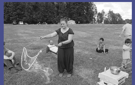
Le lancement d'EnQuête de Dieu, lors de la torrée paroissiale du Valanvorn