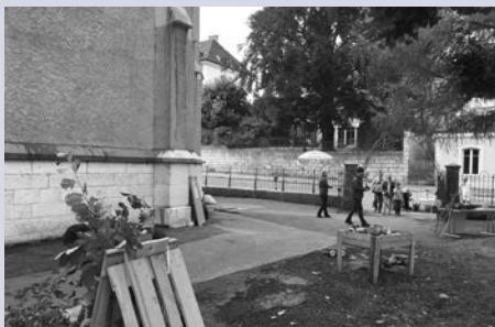
Construis ta cabane, lors de Paroisse en Fête