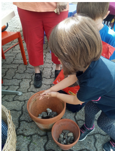
Activité jardinage à St-Jean dans le cadre de Paroisse verte

Le déneigement pose quelques problèmes dû au manque de bras forts. Le CCLLO a décidé de ne déblayer durant l'hiver qu'un passage au temple et à la salle de paroisse.