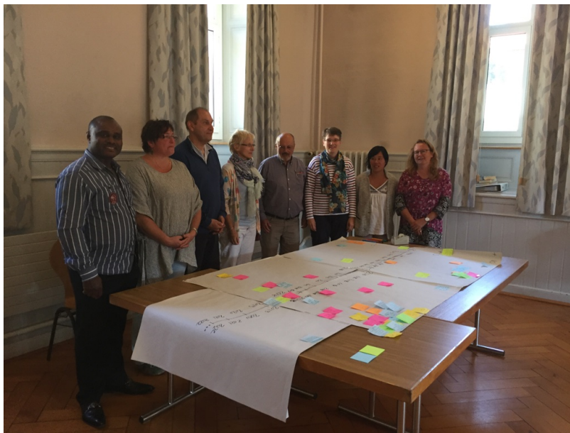
Travail sur la ligne du temps en CP-Colloque, septembre 2018

Secrétariat : EREN Paroisse La Chaux-de-Fonds Numa-Droz 75 2300 La Chaux-de-Fonds 032/913.52.52, secretariat-cdf@eren.ch www.eren-cdf.ch