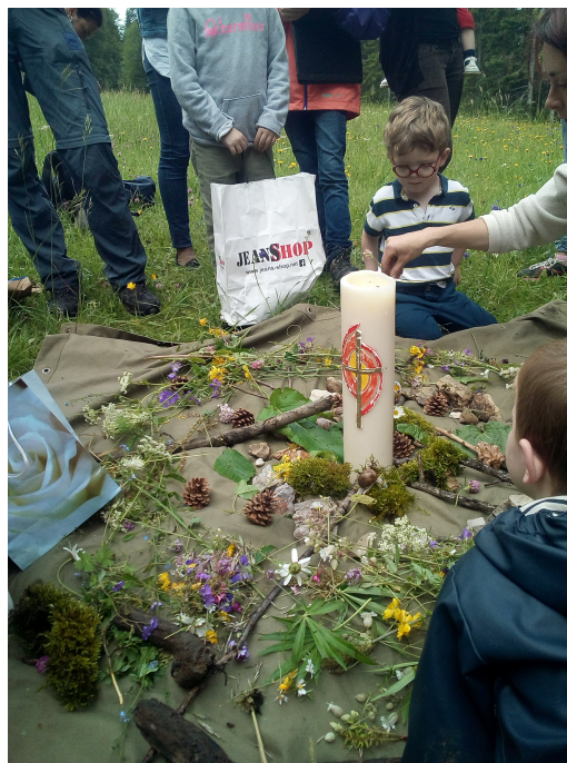
Activité enfance juin 2018