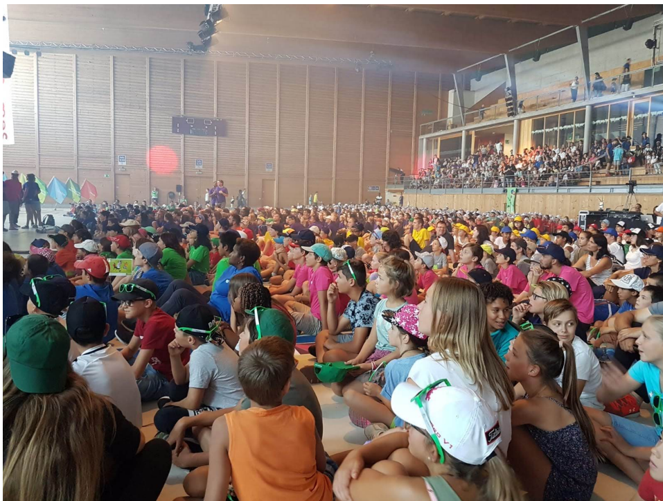
Kids games 2018