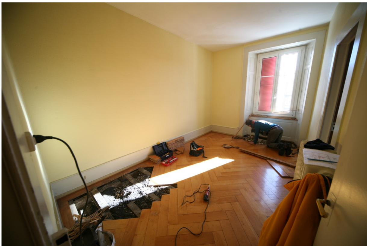
Sondage sous le plancher du futur COD

> Des sondages du plancher pour l'accueil du COD ont été effectués et vont permettre au bureau d'ingénieur de faire des propositions d'aménagement pour ce local.