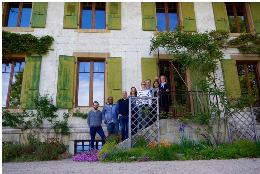
Une partie du CP et du colloque, lors de la retraite conseil-Colloque au Sénacle - mai 2017

De nombreux défis attendent la paroisse en 2018 : réconciliation, renouvellement des équipes et réalisation du Centre paroissial. Autant d'occasions de s'en remettre à Dieu et de le laisser agir dans nos vies et notre communauté.