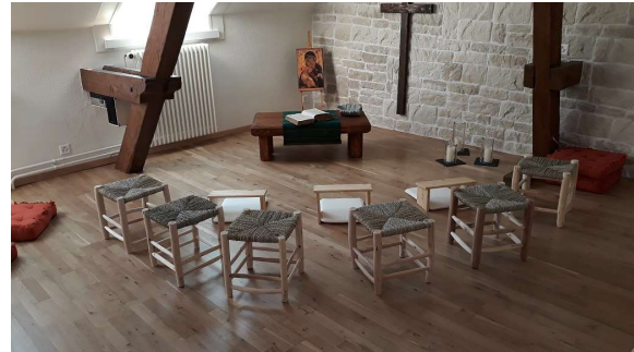
La nouvelle chapelle du centre paroissial

C'est dans un arbre nu, prêt à être fortement taillé et remodelé que l'année a commencé avec les importants travaux de rénovation et l'aménagement d'un ascenseur au Presbytère Farel. Ils ont pu être presque achevés pour Paroisse en Fête en septembre. La campagne de dons pour soutenir un objet ou une pièce du Centre paroissial a bien fonctionné. La chapelle et la cafétéria ont été aménagées ; le Centre œcuménique de documentation (Cod) et le secrétariat paroissial, ainsi que les bureaux des pasteurs ont emménagé début janvier 2020.