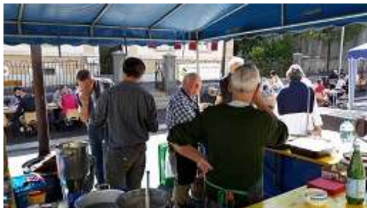
Le cœur de Paroisse en Fête !

La grande fête annuelle de la paroisse a eu lieu les 21 et 22 septembre à la salle St-Louis juste en face du centre paroissial et sur la rue qui a pu à nouveau être bouclée. La soupe et les différents menus préparés avec soin par une magnifique équipe de bénévoles ont réjoui les papilles des visiteurs et visiteuses qui ont encore pu prolonger le plaisir avec les délicieuses pâtisseries préparées avec amour. Le samedi après-midi, une petite inauguration du centre paroissial, presque terminé mais pas encore habité, a eu lieu avec la visite des lieux. Le dimanche a débuté de belle manière avec le culte d'accueil des catéchumènes.