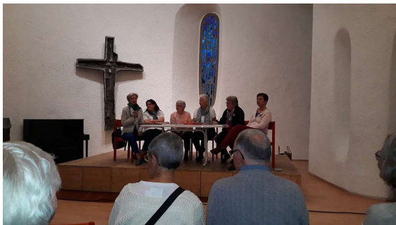
Table ronde « La place des femmes dans l'église »

Dans cette ramure très dense, arrêtons-nous sur quelques jeunes rameaux : un espace de parole a été mis sur pied et a lieu tous les deux mois. La formation Eglise de témoins a débuté en novembre avec un groupe d'une trentaine de personnes engagées à suivre les 6 modules un samedi matin par mois. Des premiers fruits savoureux apparaîtront au printemps 2020. De nombreuses et riches activités ont eu lieu dans la nouvelle chapelle et la cafétéria du Centre paroissial.