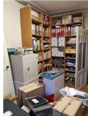
Mise en cartons du secrétariat

Au mois de janvier, suite aux travaux préparatifs du DFBI et du CP, un nouveau poste paroissial a été créé. La structure du poste à 30% comprend la gestion de la conciergerie et l'accompagnement de nos deux dames de ménage (employées dans le cadre du chèque-emploi neuchâtelois, Ticketac). La gestion des locations est le second volet important du poste. Enfin 5 fois par an, la conception avec le comité de rédaction, puis la mise en œuvre de la parution et de l'acheminement du Porte-Parole viennent compléter les tâches inhérentes au poste.