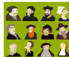
Calendrier 2017 les Réformateurs