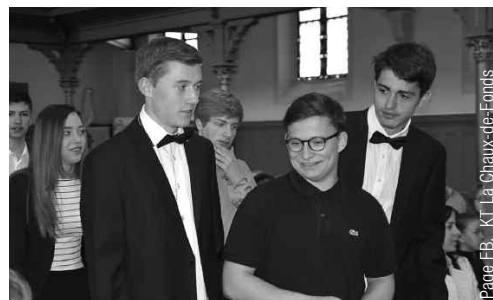
Page FB, KT La Chaux-de-Fonds